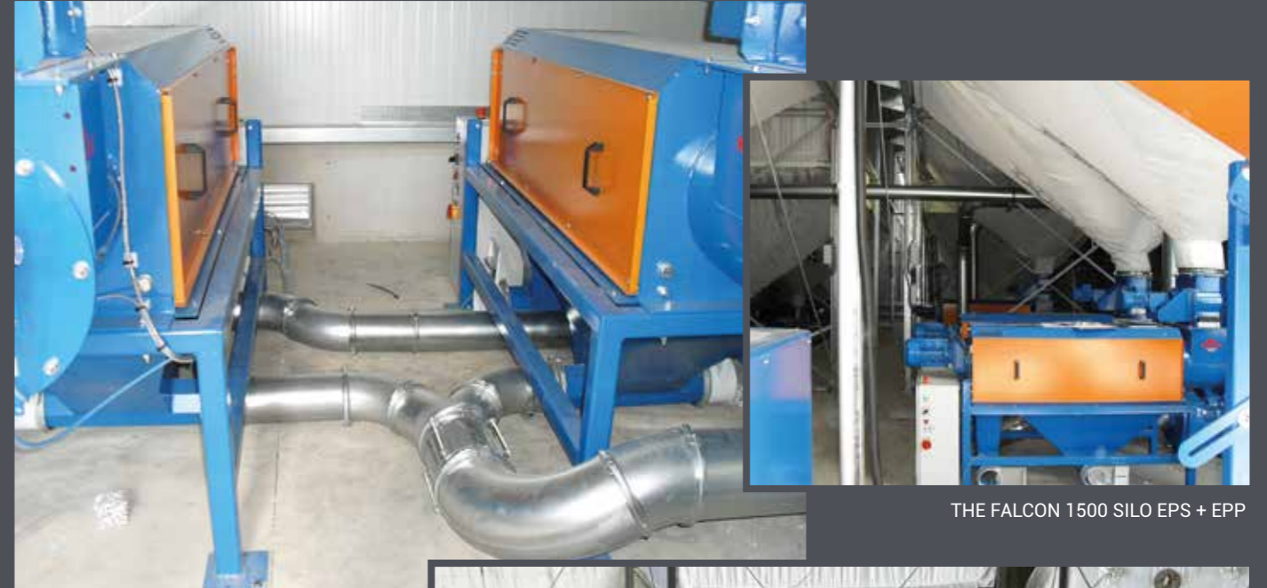
THE FALCON 1500 SILO EPS + EPP