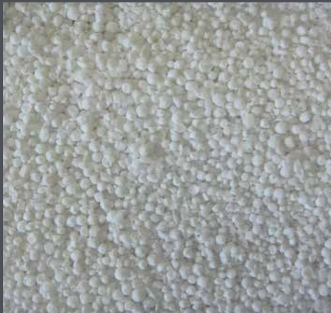
EPS Re-Granulat aus Feinzerkleinerung, entstaubt