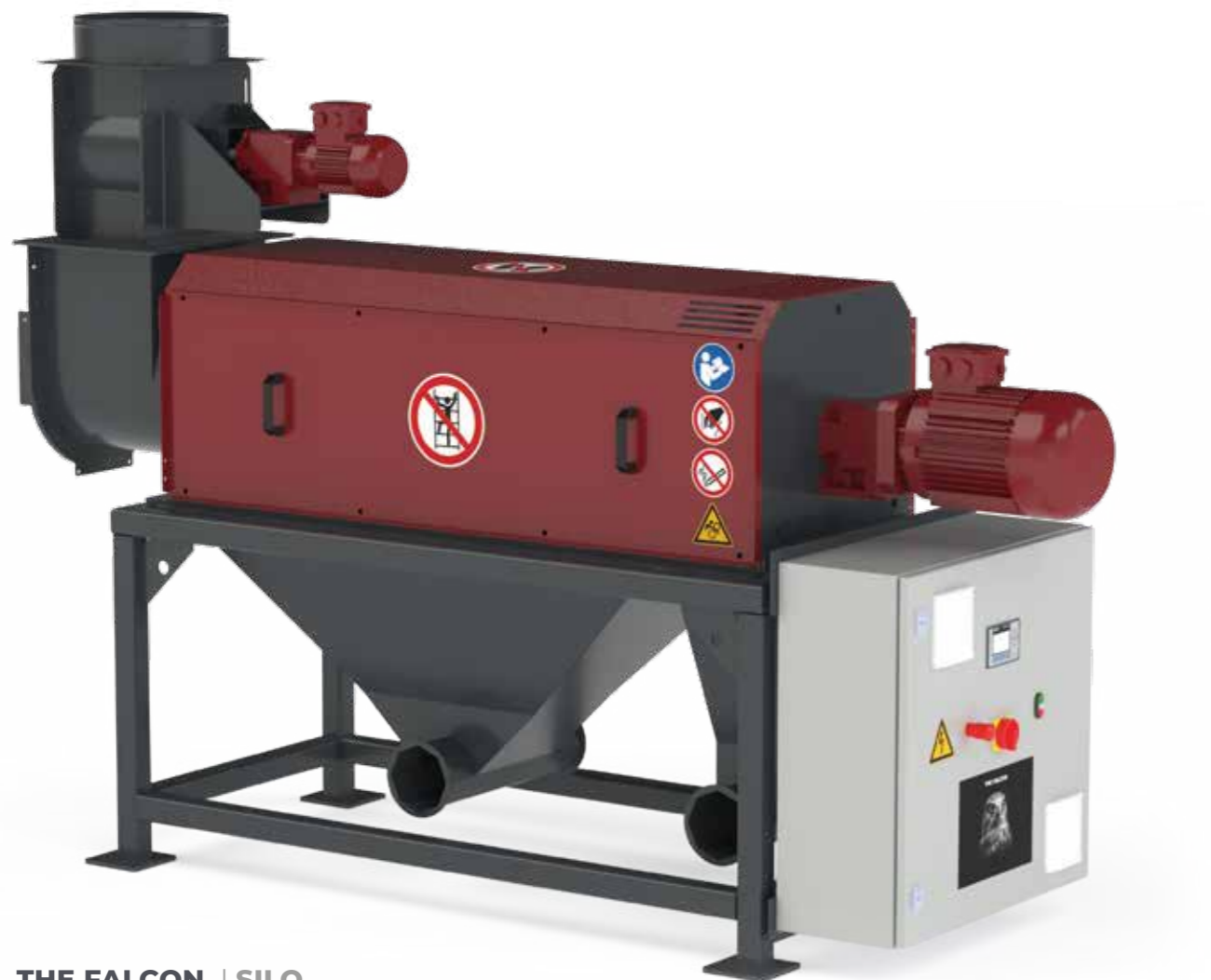
THE FALCON. | SILO

Unsere Misch- und Dosiersysteme der Baureihe THE LUX sind die optimale Ergänzung zur Herstellung von Formteilen oder Blöcken aus aufbereitetem Re-Granulat.