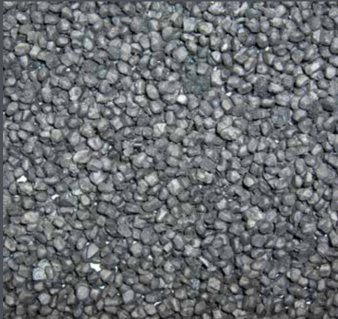
EPP Re-Granulat aus Feinzerkleinerung, entstaubt