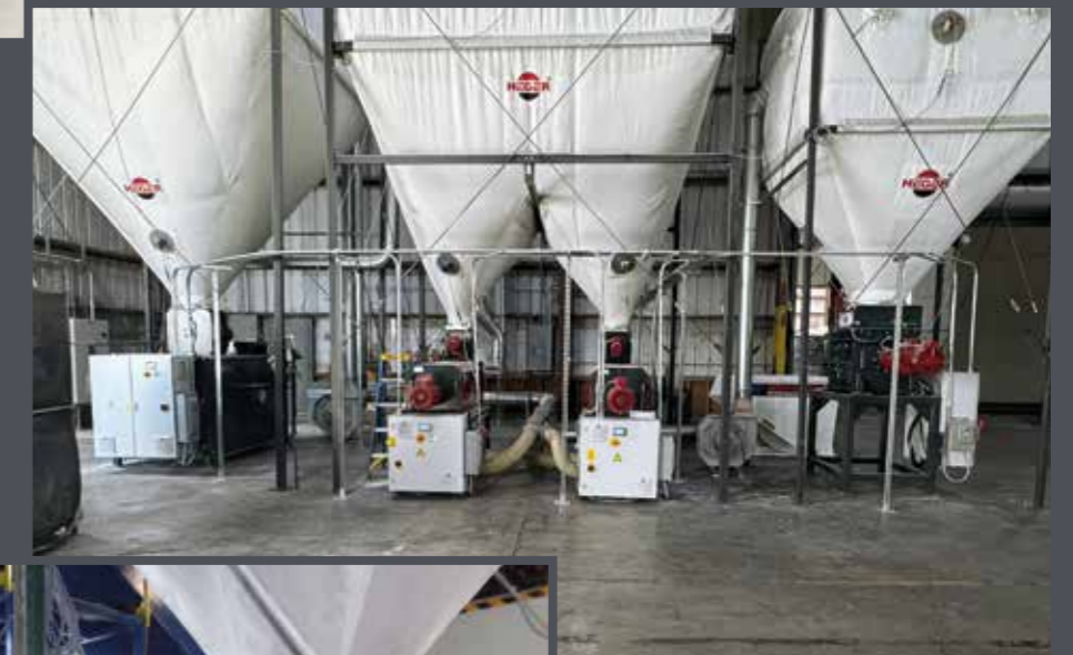
THE FALCON 1500 SILO EPS + EPP