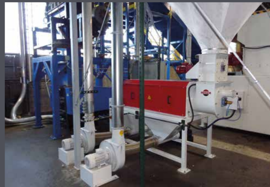
THE FALCON 1500 SILO EPS + EPP